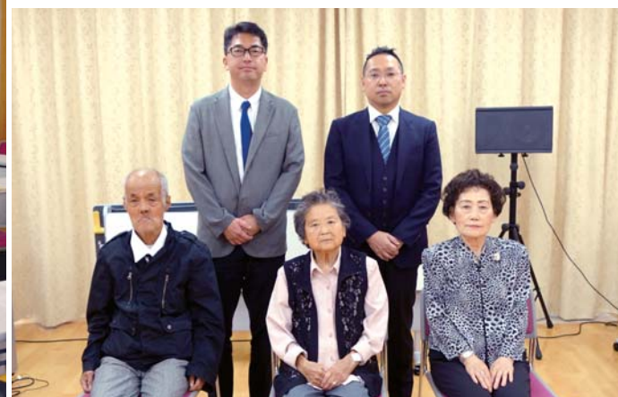
永年透析表彰者のみなさま、おめでとうございます。

また、特別養護老人ホームくさど申間施設長の指導で、脳を活性化し認知症予防に役立つ運動『コグニサイズ』を体験しました。笑顔で一生懸命体を動かす患者様の様子に、今後も微力ではありますがしっかり支えられるよう努めていこうと心新たに感じた会となりました。