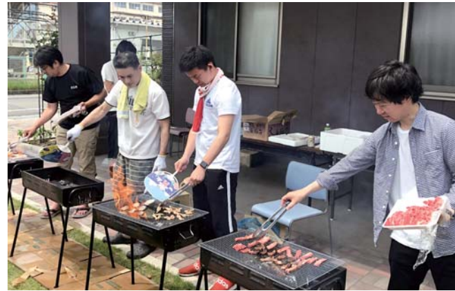
ご協力いただいた各事業所のみなさま、ありがとうございました!

7月28日、特別養護老人ホームしんがいで介護事業部のガーデンパーティが行われました。介護事業部では昨年、スタッフ手作りのガーデンパーティで、自分たちの家族も招いて懇親を深めています。広場で大好評のバーベキューをしたり、スタッフの子どもたちはプールを楽しんだりして、暑さを忘れ、笑顔あふれる1日となりました。