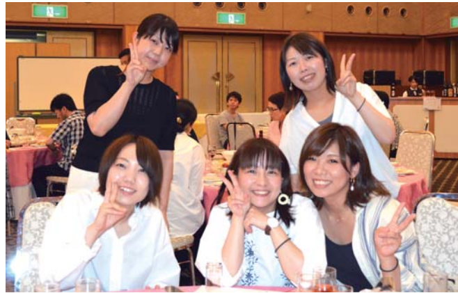
幹事:3階・4階病棟、透析室、手術室 幹事のみなさま、お疲れさまでした!

7月25日、総合結婚式場みやびで医療事業部のビアパーティが行われました。永年勤続表彰、資格取得者表彰に続いて、今回のメインイベント、「サプライズ!ビンゴゲーム」が始まりました。ビンゴゲームが一旦終わると見せかけ、サプライズで、豪華な金・銀・銅賞の景品が用意されており、会場は外の暑さに負けない熱狂に包まれて大いに盛り上がりました。