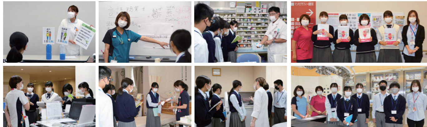
金光学園中学校、近大附属福山中学校

新型コロナで何かと制約が多い世の中ですが、生徒のみなさんがこれから地域に出ている色々な方とふれあい、人と繋がる楽しさや素晴らしさを感じながら成長していくことを願っています。