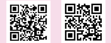
マイナ保険証について NOBORIについて