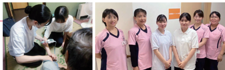
福山平成大学 看護学科

今年も多くの実習生が来てくれました。訪問看護の実習では、実際に利用者様の自宅に伺い、血圧などのバイタル測定、食事内容や水分摂取量・睡眠・排泄など日常生活について情報収集を行いました。授業では学べないたくさんの気づきがあったようです。今後も応援しています！！